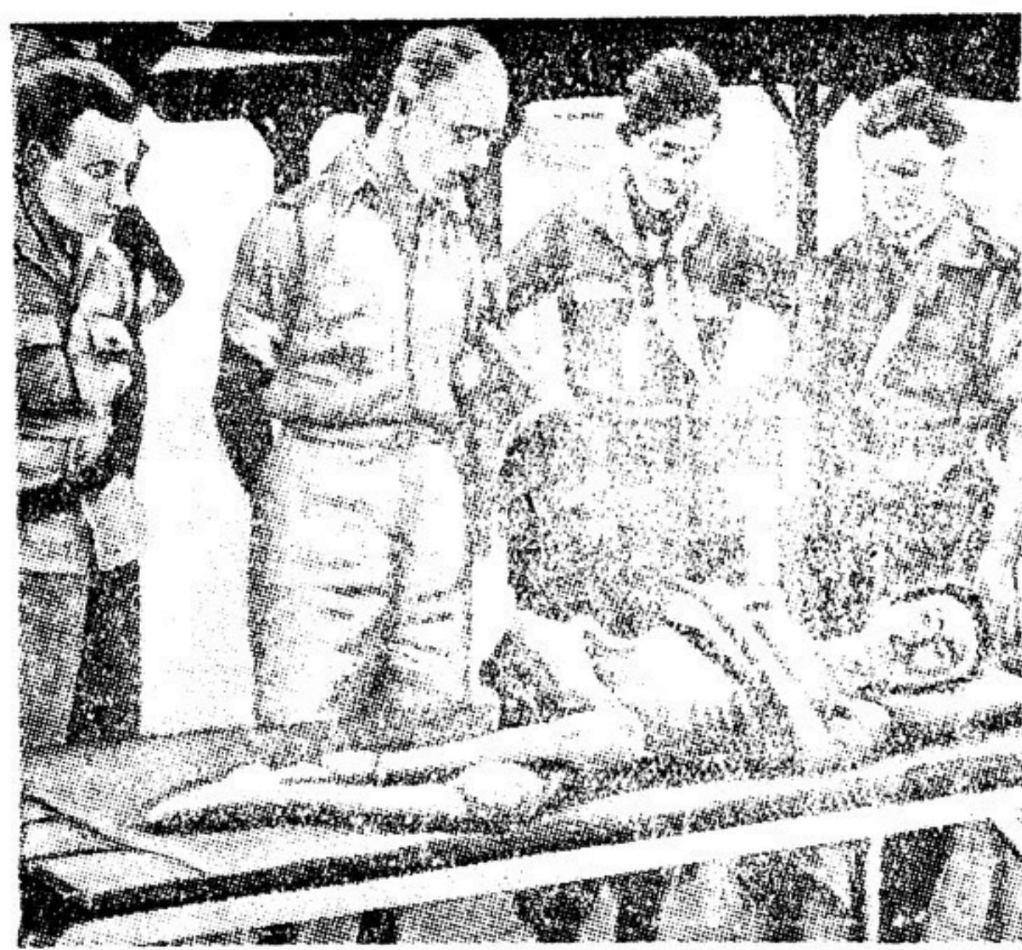
Какой «культурный», выложенный вид у этих мерзавцев в офицерских мундирах голландской армии...

Газеты пестрят фактами, свидетельствующими о том, что остатки войск фашистского «фюрера» пошли в наем и услужение к империалистам не только на немецкой земле.